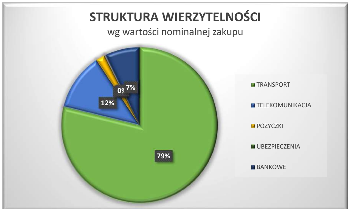
Wykres 3 Struktura posiadanych wierzytelności

Wszystkie posiadane przez Spółkę wierzytelności masowe pochodzą z pięciu branż: transportowej, telekomunikacji, bankowości, pożyczek i ubezpieczeń. Dominujące są masowe wierzytelności transportowe, a struktura przedstawia się jak na załączonym wykresie.